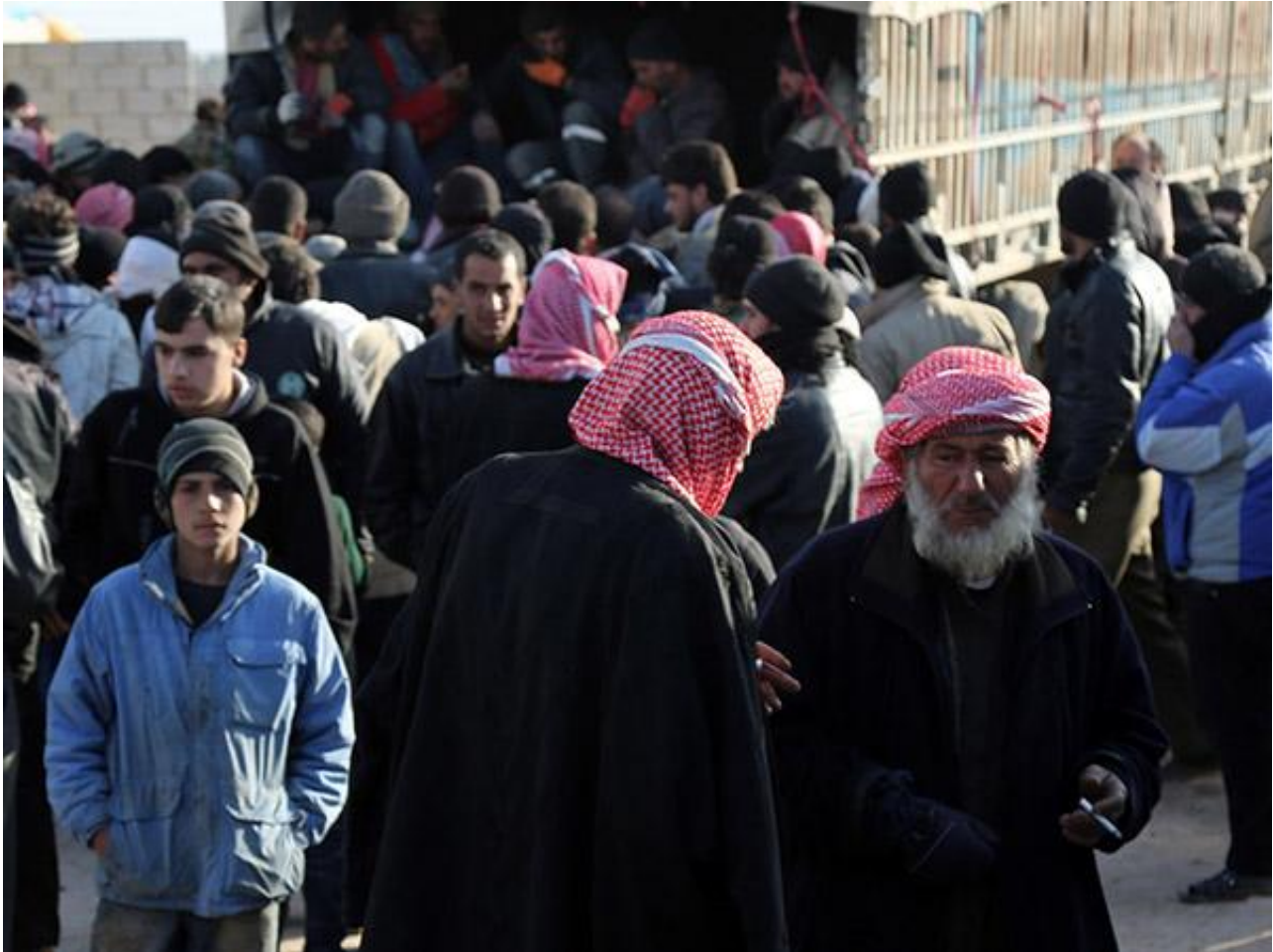
部分阿勒颇难民将前往土耳其安置