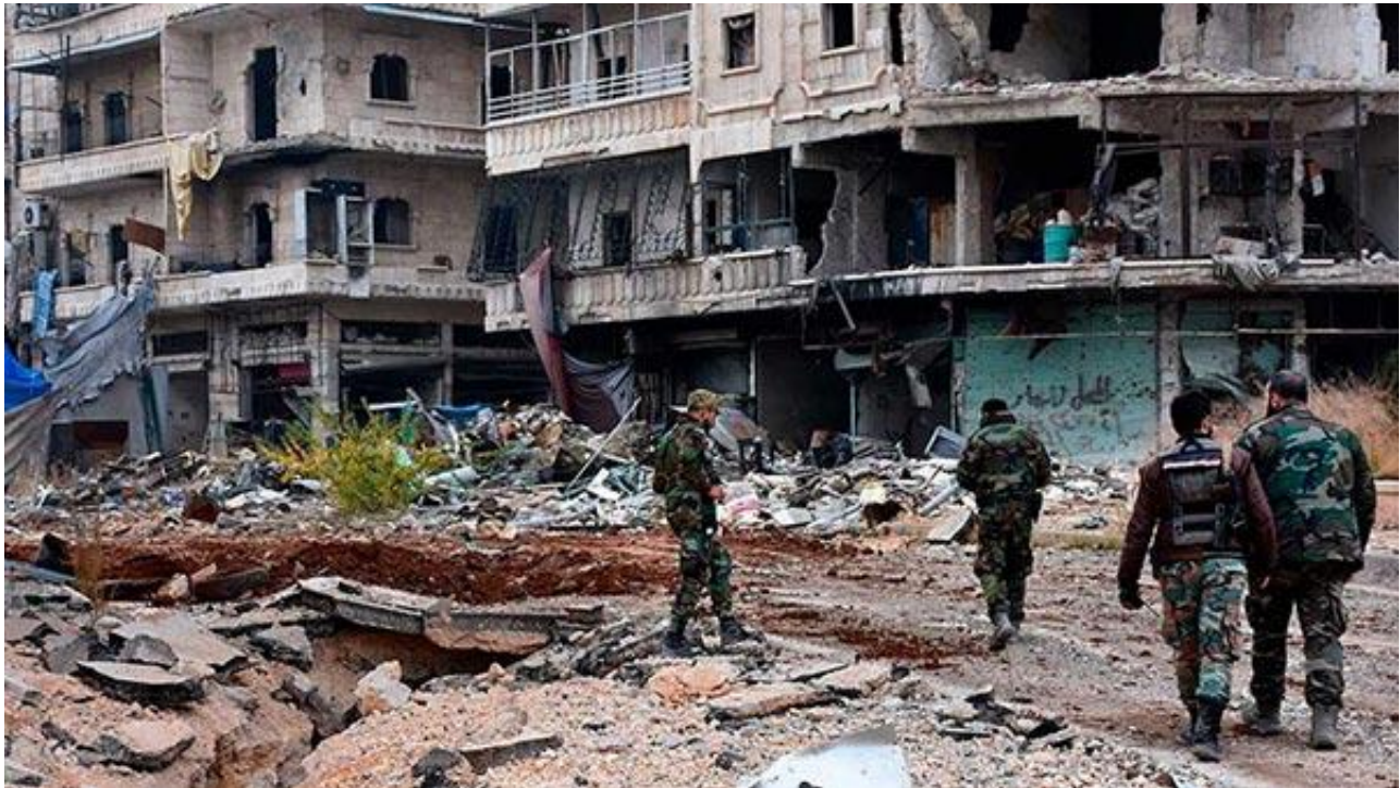
叙利亚政府军进入城区

据新华社14日报道，叙政府军中将扎伊德·阿勒萨利赫是叙政府设立的阿勒颇安全委员会负责人。他在政府军12日收复的谢赫·赛义德区对媒体记者说：“在阿勒颇东部的战事已进入最后阶段，他们（反对派武装）没有多少时间了。他们要么投降要么受死。”