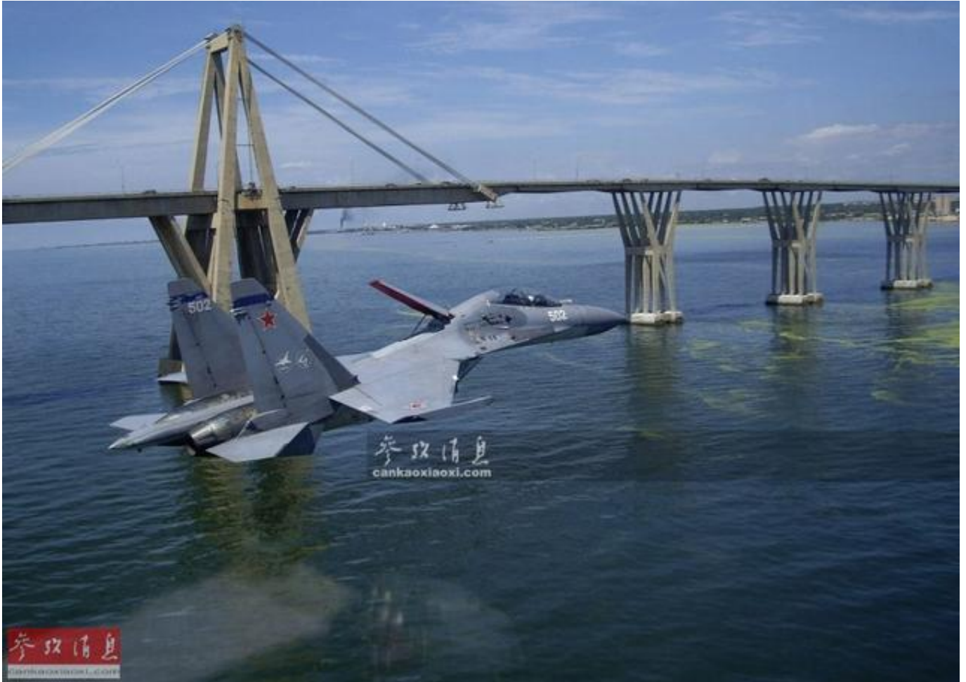
资料图：俄空军苏-30战机掠海飞行，可见飞行高度低于桥面

俄罗斯媒体26日援引伊朗国防部长侯赛因·达赫甘的话报道，伊朗政府眼下正考虑向俄罗斯购买苏-30战机，并表示这件事“已经提上伊朗国防部议程”。